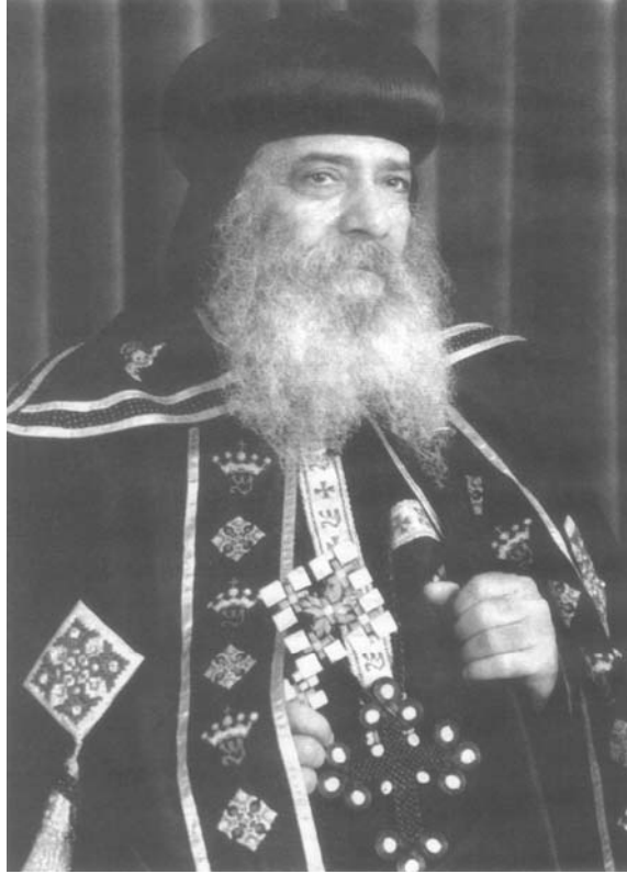
حضرة صاحب القداسة والغبطة الأنبا شنودة الثالث بابا الإسكندرية وبطريك الكرازة المرقسية