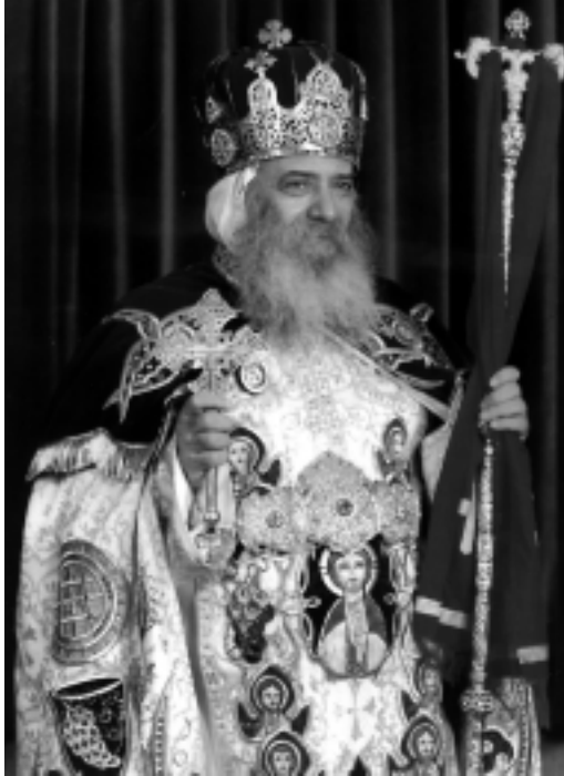
حضرة صاحب القداسة والغبطة الأنبا شنودة الثالث بابا الأسكندرية وبطريك الكرازة المرقسية